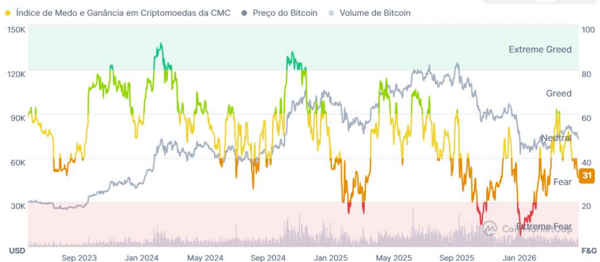
Gráfico do Índice de Medo e Ganância

Imagem: índice de medo e ganância que mede o nível de sentimento do mercado.