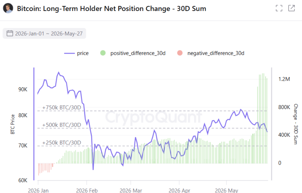
Imagem: fluxo de BTC por detentores de longo prazo.

Por outro lado, os detentores de longo prazo continuam otimistas. Enquanto o preço do Bitcoin saiu da faixa dos $82 mil para perto dos $73 mil ao longo das últimas semanas, o indicador de acumulação on-chain por detentores de longo prazo disparou para cima . Isso cria uma divergência relevante: o preço enfraquece no curto prazo, mas as mãos mais pacientes do mercado estão absorvendo. Esse comportamento não reverte a pressão do momento, mas sinaliza que há convicção estrutural sendo construída pelos detentores de longo prazo.