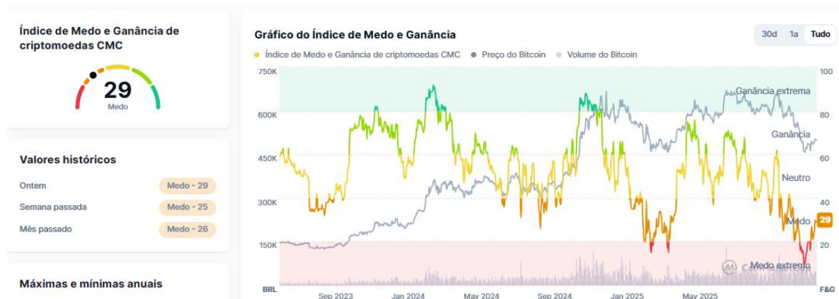
Imagem: índice de medo e ganância que mede o nível de sentimento do mercado.

Apesar de apresentar um comportamento muito volátil no curto prazo, com o Bitcoin oscilando rapidamente entre 89.000 a 94.000 dólares durante a semana, o mercado cripto está gradativamente se recuperando do cenário de extremo medo visto nas semanas anteriores. Ainda assim, o mercado segue receoso, embora esteja apresentando um sentimento mais brando de medo: