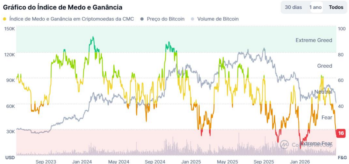
Gráfico do Índice de Medo e Ganância

Imagem: índice de medo e ganância que mede o nível de sentimento do mercado.